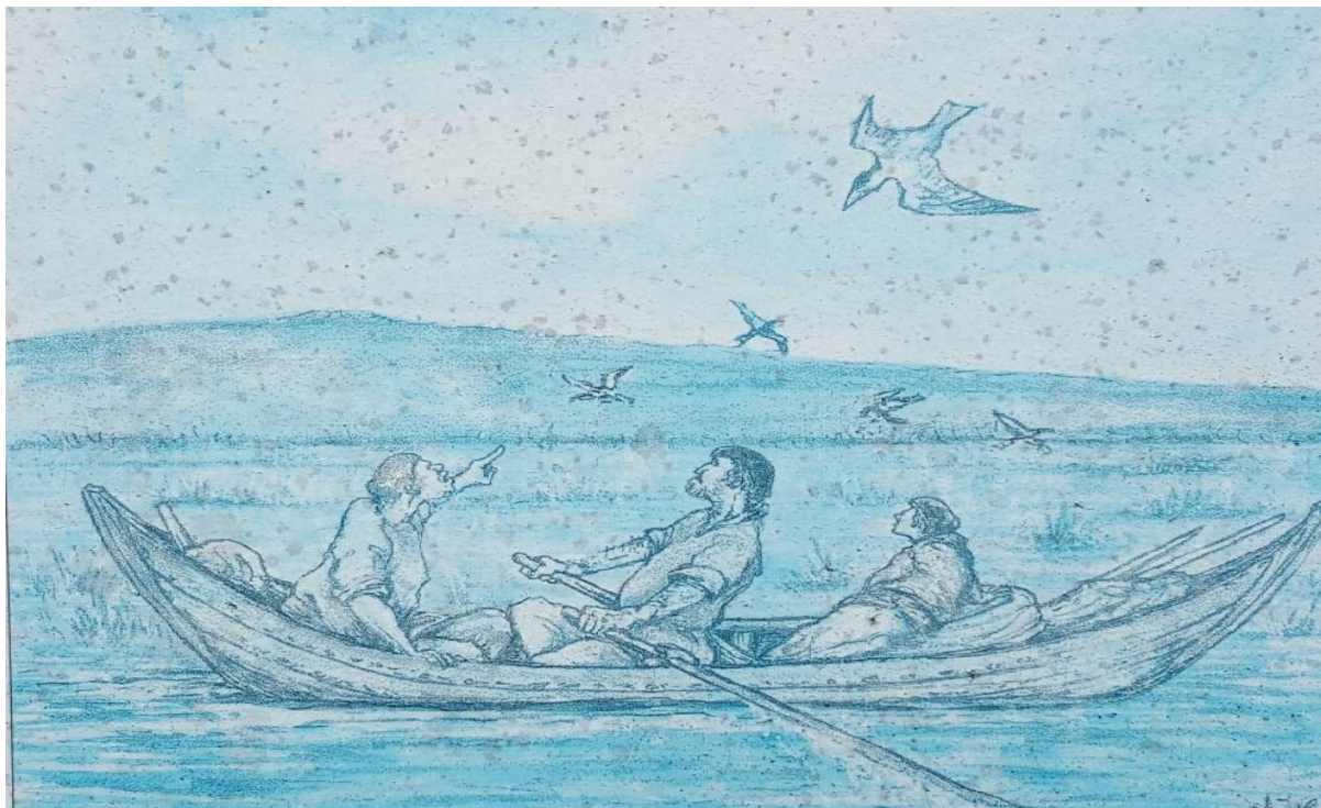
Jakt och fiske i de grunda vikarna under järnåldern.