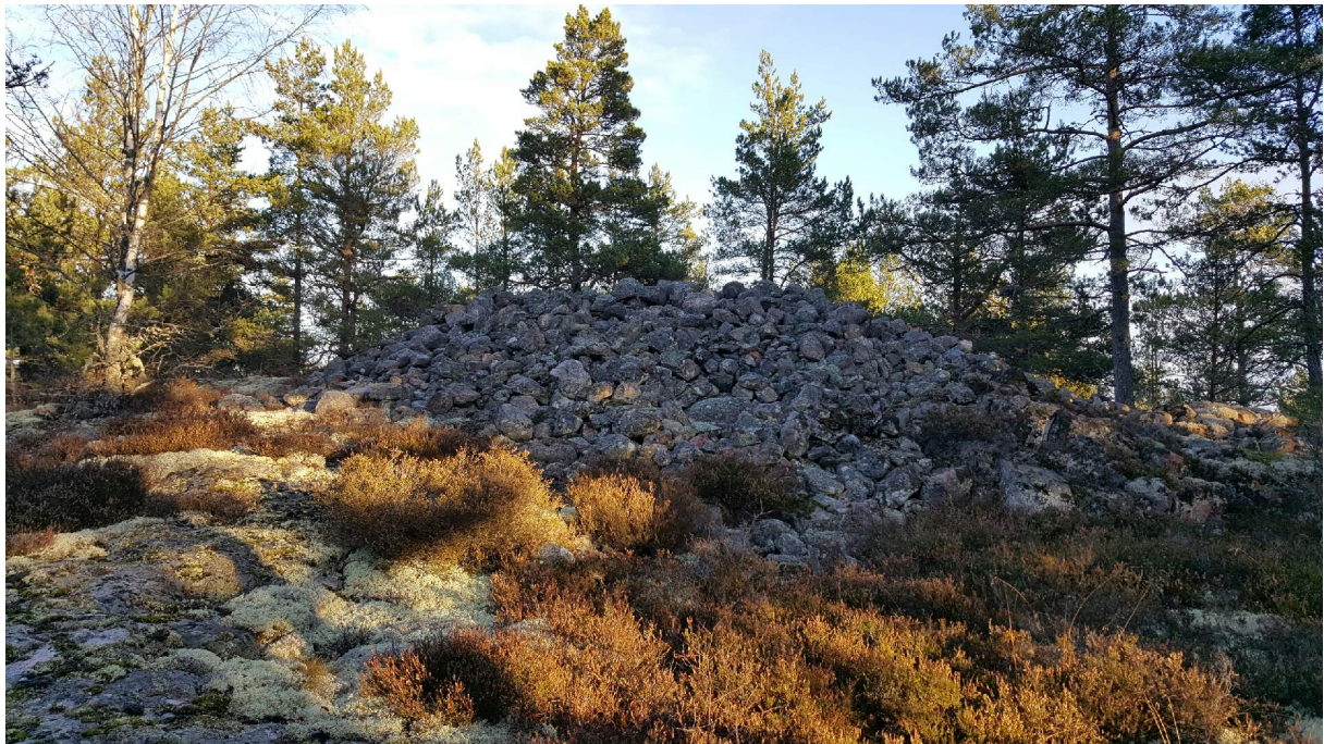
Ett av de största stenrösen från Bronsåldern finns på bergen mellan Östra och Västra banan.