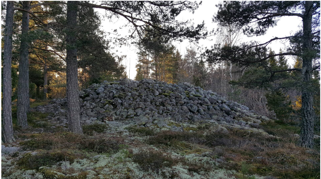
Ett stort synligt röse längst upp på åsen till vänster (öster) om hål 3 Västra och korthålet 4 Västra.